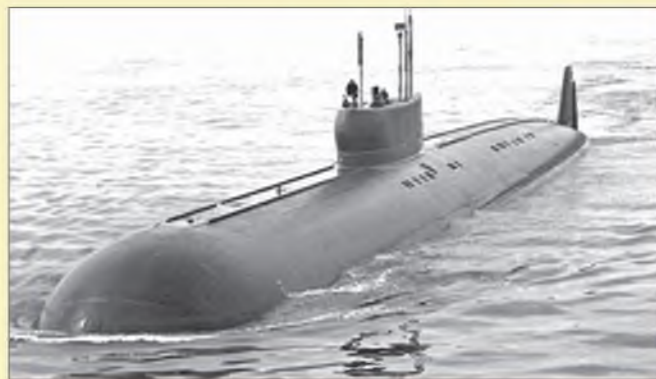
АПЛ К-162 проекта «Анчар» ▲ ▼