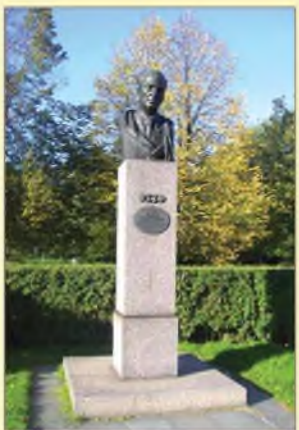
Бюст Н.Н. Исанина установлен в Санкт-Петербурге на Аллее Героев в Московском парке Победы ▲