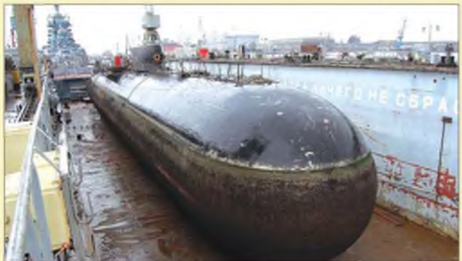
Атомная подводная лодка К-222 (Проект 661 «Анчар») перед утилизацией Центр судоремонта «Звёздочка» ▼

В 1950-е годы XX века ВМС США сделали стратегический упор на авианосные ударные группировки. Гигантский авианосец в окружении крейсеров, эсминцев и подлодок должен был впечатлить всех потенциальных противников. В Советском Союзе разработали иную концепцию. Вместо того, чтобы строить гигантские крейсера для грандиозных морских боёв, было решено создать небольшие, но очень быстрые и хорошо вооружённые подлодки, способные приблизиться к авианосцу и вывести его из строя ракетным залпом.